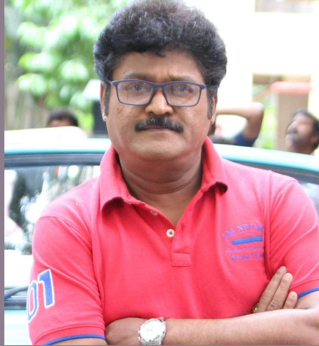
NAVARASA NAYAKA JAGGESH