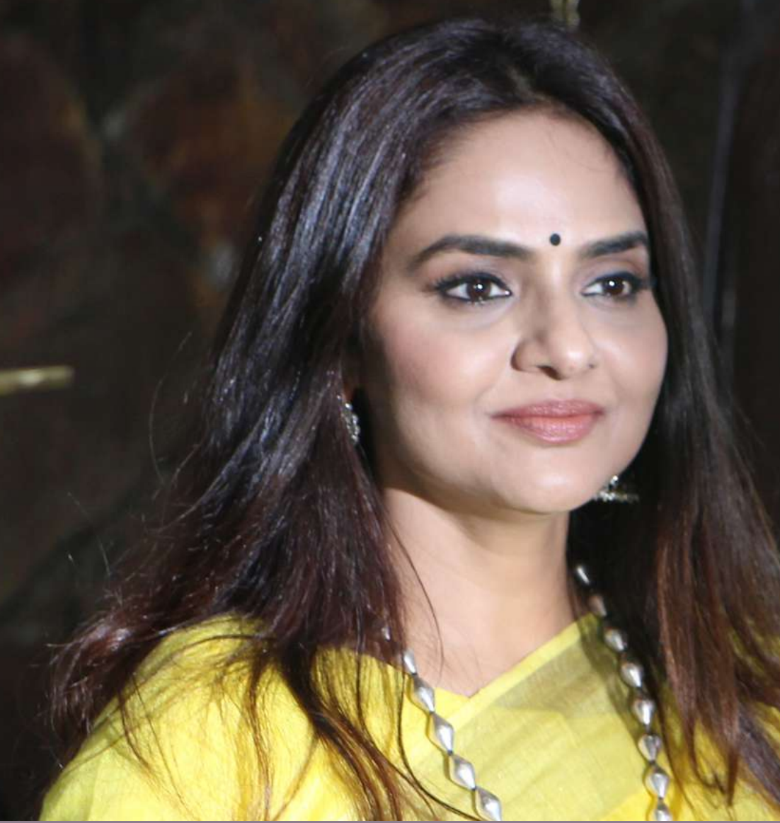
ROJA MOVIE FAME MADHUBALA